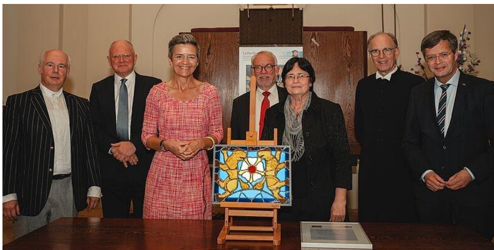
Margrethe Vestager (derde van links) ontvangt de Lutherrose 2022