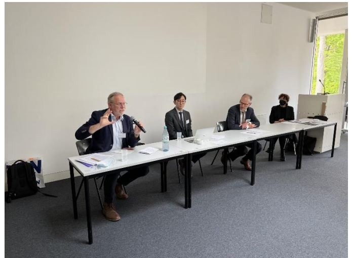
Short Paper Panel

Tijdens deze conferentie konden ook nieuwe contacten gelegd worden en ideeën uitgewisseld worden voor toekomstige projecten.