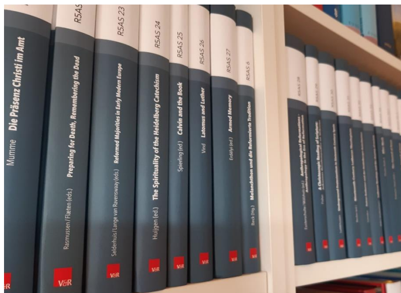
R5AS Serie (Vandenhoeck & Ruprecht)

In 2022 zijn tien delen verschenen in deze serie, die nu 94 delen totaal telt. Het honderdste deel wordt in 2023 verwacht. In deze reeks worden monografieën en thematische bundels gepubliceerd in verschillende talen. Refo500 Academic Studies (R5AS) kenmerkt zich door een interdisciplinaire aanpak, internationale samenwerking en een hoog wetenschappelijk niveau.