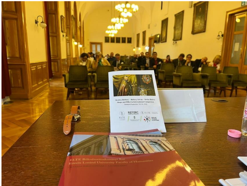
Kick-off Conferentie over Stephan Báthory in Budapest, 14 september