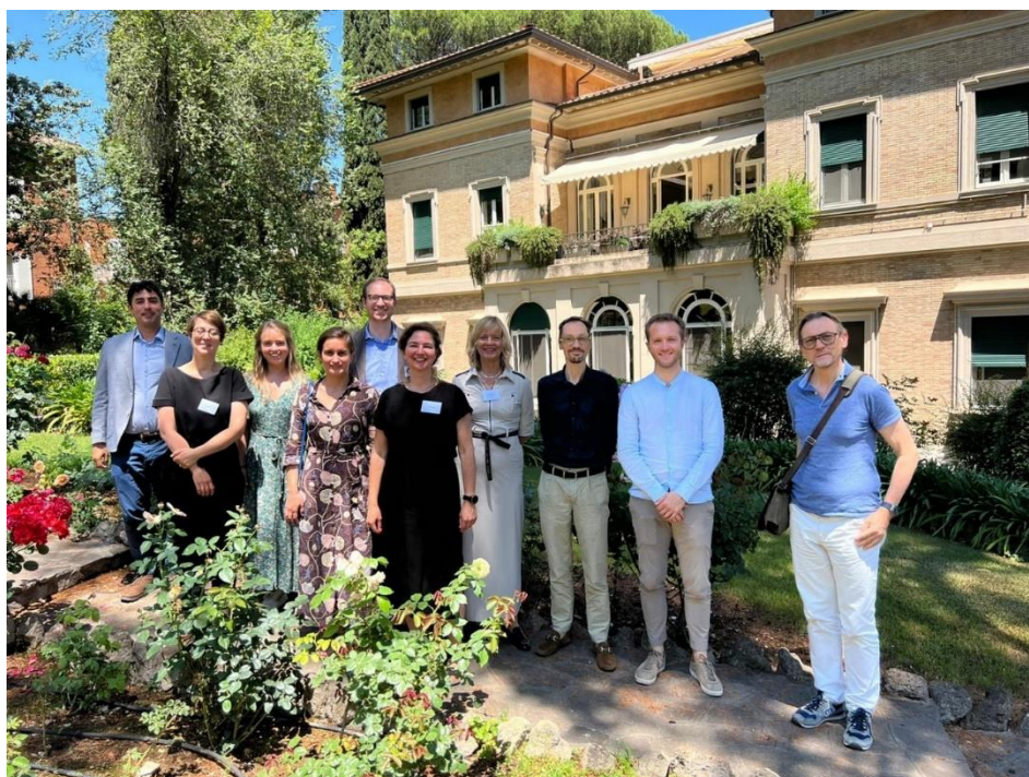
Een aantal van de deelnemers aan de Coram Deo Program conferentie in Rome

In samenwerking met het KNIR (Koninklijk Nederlands Instituut Rome) en DHI (Deutsches Historisches Institut) werd de conferentie The Responsible Society in Early Modern Christianity. Voices & Fruits georganiseerd. De conferentie werd op 13 en 14 juni 2022 in Rome gehouden.