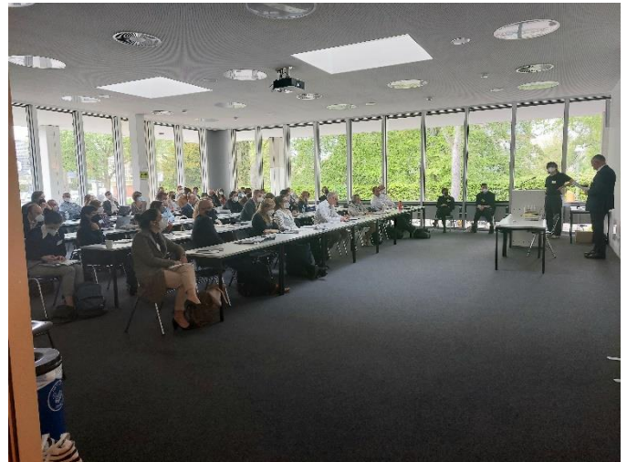
Plenaire bijeenkomsten van de Eleventh Annual REFORC Conference on Early Modern Christianity